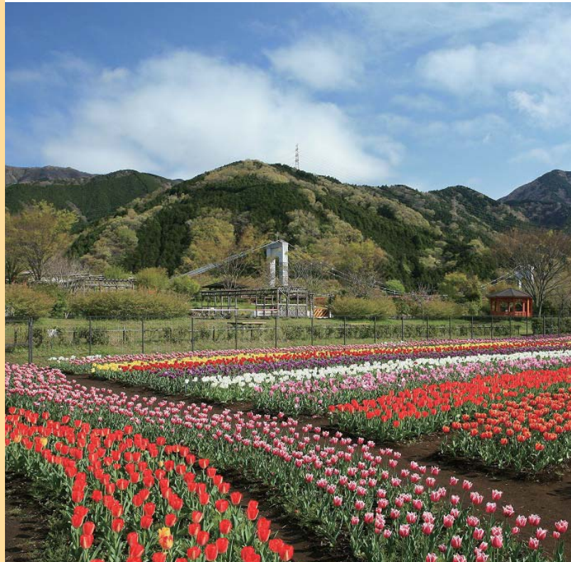
「山麓に広がる虹色絨毯(秦野戸川公園)」